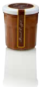
POT DE CHOCOTARTINÉ®