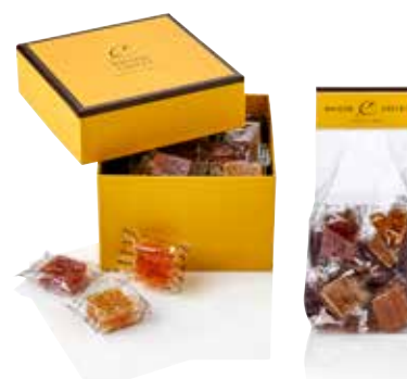
COFFRET & SACHET PÂTES DE FRUITS