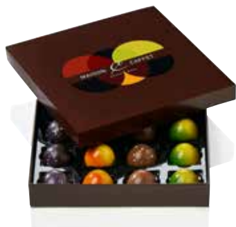
COFFRET 16 DÔMES ( CARAMELS ONCTUEUX )