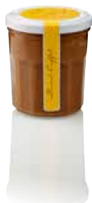
POT DE CHOCOPRALINÉ®