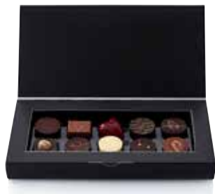
COFFRET 10 CHOCOLATS ASSORTIS SIGNATURE