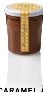
POT DE CARAMEL À LA FLEUR DE SEL