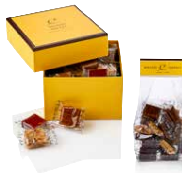
COFFRET & SACHET CARMELS