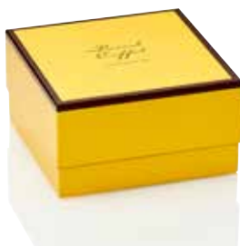
COFFRET LES PETITS ENVELOPPÉS TAILLE 3 ( ENVIRON 60 CHOCOLATS )