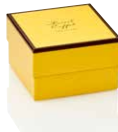
COFFRET LES PETITS ENVELOPPÉS TAILLE 2 ( ENVIRON 45 CHOCOLATS )