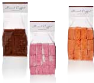
SACHET GUIMAUVES Chocolat, framboise, passion, praliné ou vanille