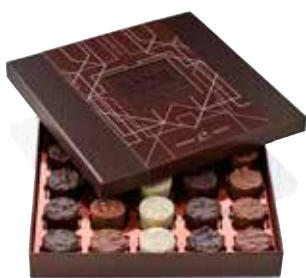
COFFRET 25 PRALINÉS « LES ROCHERS »