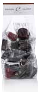
SACHET LES PETITS ENVELOPPÉS TAILLE 2 ( ENVIRON 20 CHOCOLATS )