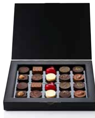
COFFRET 20 CHOCOLATS ASSORTIS SIGNATURE