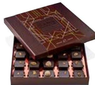
COFFRET 25 PRALINÉS « LES INATTENDUS »