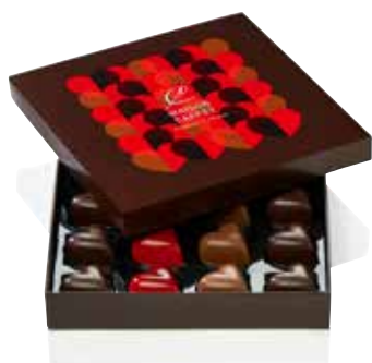
COFFRET 16 CŒURS ( NOS PRALINÉS EMBLÉMATIQUES )