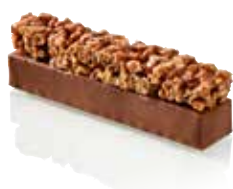
BARRE CHOCOLATÉE CROUSTILLE