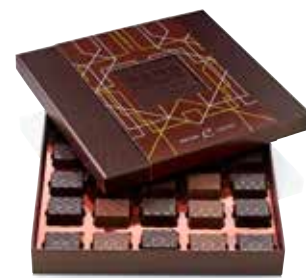
COFFRET 25 PRALINÉS « LES MORTIERS D'OR »