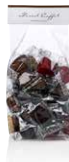
SACHET LES PETITS ENVELOPPÉS TAILLE 3 ( ENVIRON 30 CHOCOLATS )