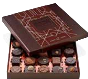
COFFRET 25 PRALINÉS ASSORTIS