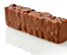
BARRE CHOCOLATÉE RENVERSANTE