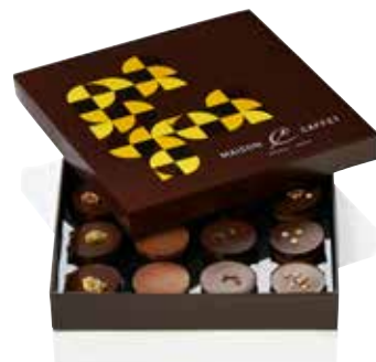
COFFRET 16 ENTRE DEUX ( PÂTES D'AMANDES ASSOCIÉES AUX PRALINÉS )