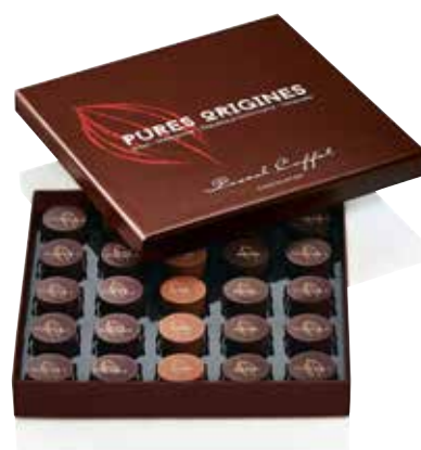
COFFRET 25 CHOCOLATS PURES ORIGINES