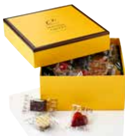
COFFRET LES PETITS ENVELOPPÉS TAILLE 1 ( ENVIRON 25 CHOCOLATS )