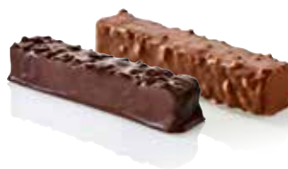
BARRE CHOCOLATÉE FAVORITE NOIR OU LAIT