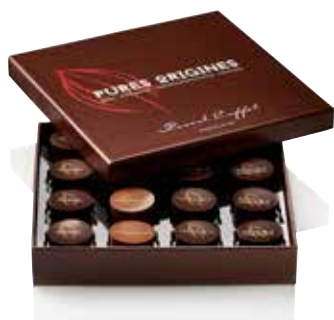
COFFRET 16 CHOCOLATS PURES ORIGINES